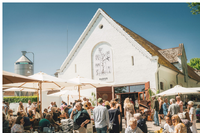
Destilleriet i den gl. herregårdsstald