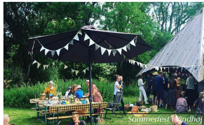
Sommerfest i Vindhøj