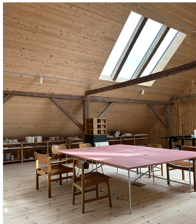
Arkitekternes tegnestue på 1. sal i staldbygningen

Der er ikke lavet en overordnet plan for de gamle godsbygningers anvendelse fremover. De omdannes løbende til nye anvendelser, når behovet opstår; stadig under hensyntagen til bygningernes bevaringsværdier og det samlede kulturmiljø.