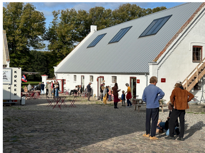
Den nyindrettede staldbygning