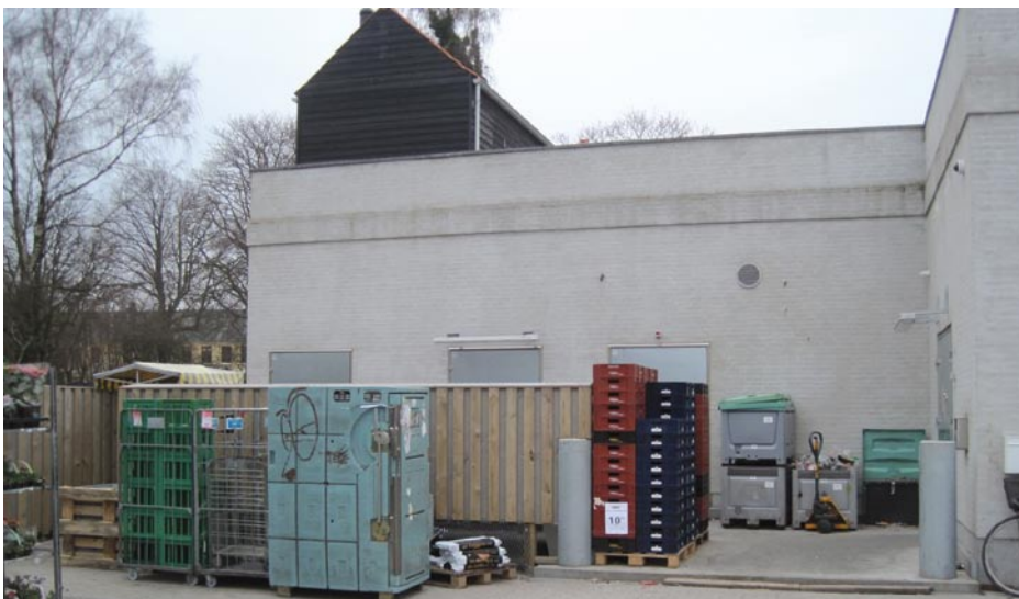
Netto, april 2013