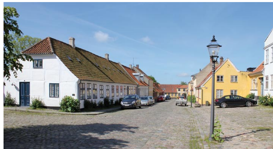
Torvet 2, med det flotte tegltag, bestående af genbrugstegl.