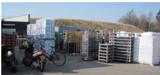
Rema 1000, april 2013

møde med kommunaldirektøren den 3. juni 2013. I skrivende stund kan vi konstatere at Netto nu har pillet bannerne og opslag på facaderne ned. Det er godt. Imidlertid trænger der stadig til oprydning, indgangen mod vandet er endnu ikke lukket, der mangler farve på facaderne, livskraftige træer på parkeringspladsen og grønt opad facaden mod vandet! Og så er der lige Rema 1000 og Super Best!