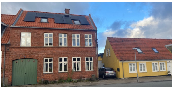
Solceller på tagene af købstadens huse. Her Vesterbro, 4720 Præstø. Er det med til at forskønne byen?

Ved det kommende årsskifte skal vi sige farvel til Facaderådet. Vordingborg Kommune har i forbindelse med en sparerunde for et år siden besluttet at nedlægge facaderådene i kommunens købstæder. Facaderådet i vores by har eksisteret i en længere årrække helt